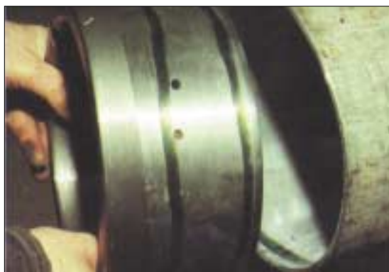
Теперь стальная оконечная муфта крепится с помощью клеящего состава Loctite 638. Больше не требуется нарезать ни внутреннюю, ни внешнюю резьбу на втулке.

Стопорящие адгезионные составы фирмы Локтайт позволяют избежать вышеперечисленные негативные явления, либо усиливая механические соединения, либо полностью заменяя их клеевыми.