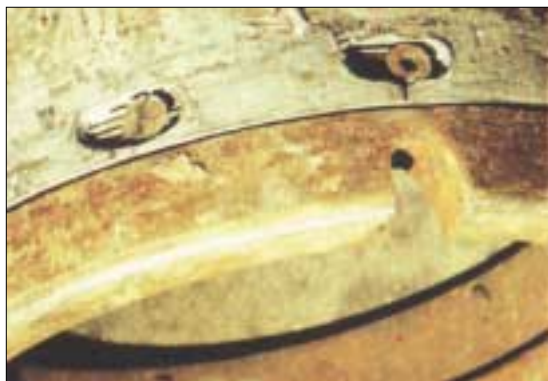
Растягивание внутреннего ролика привело к тому, что отверстия для стопорных винтов удлинились, и резьбовое крепление муфты ослабло.