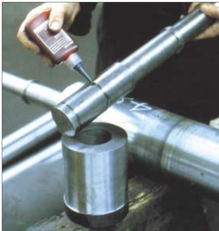
Клеевое соединение вала и цапфы ролика, которое экономит 1,5 часа времени на токарную обработку.

Необходимость наличия постоянного запаса всевозможных элементов для различных типов соединения значительно повышает стоимость традиционных методов крепления.